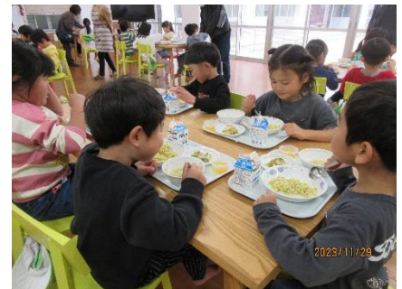
年長さん、ちょっぴり緊張しながらもドライカレーを完食しました。